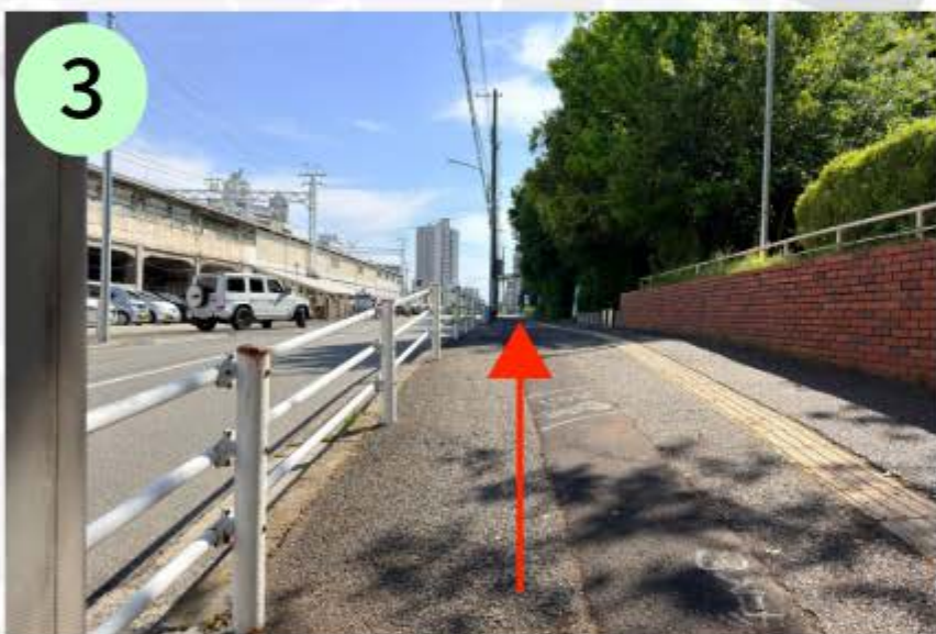
個別館さんの見える横断歩道まで直進する