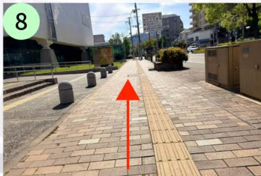
道なりに沿って直進