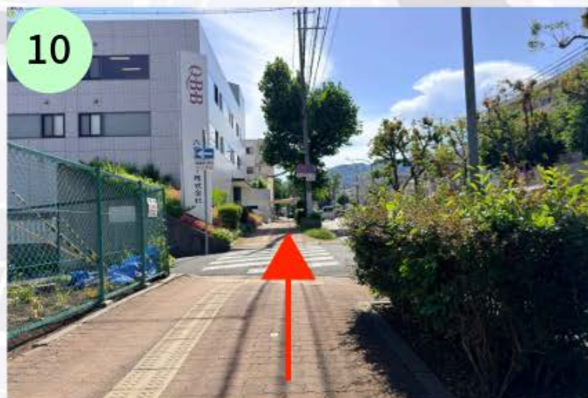
QBB 六甲バターさんを過ぎて次の横断歩道を渡った左手に目的地