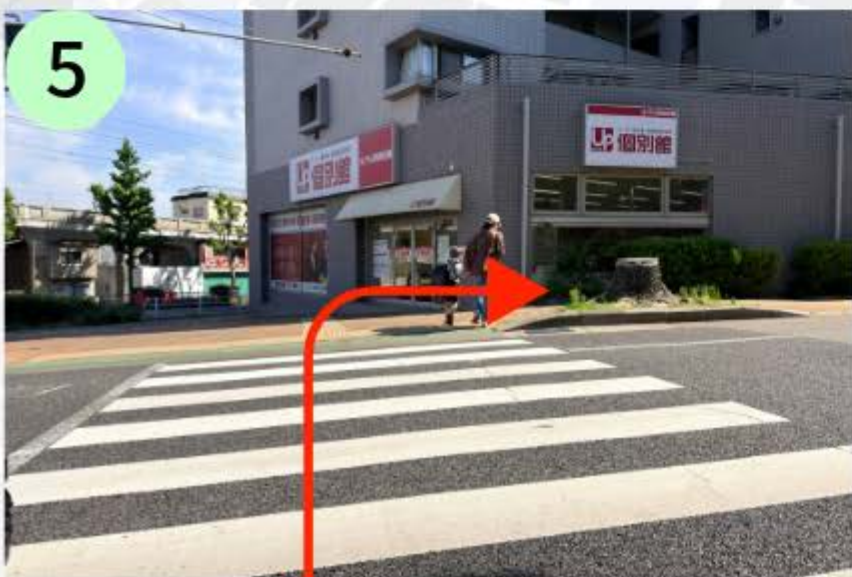
横断歩道を渡り個別館さんを右に曲がる